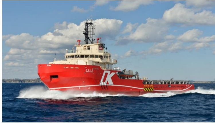
(川崎汽船グループが運航するオフショア支援船“あかつき”)