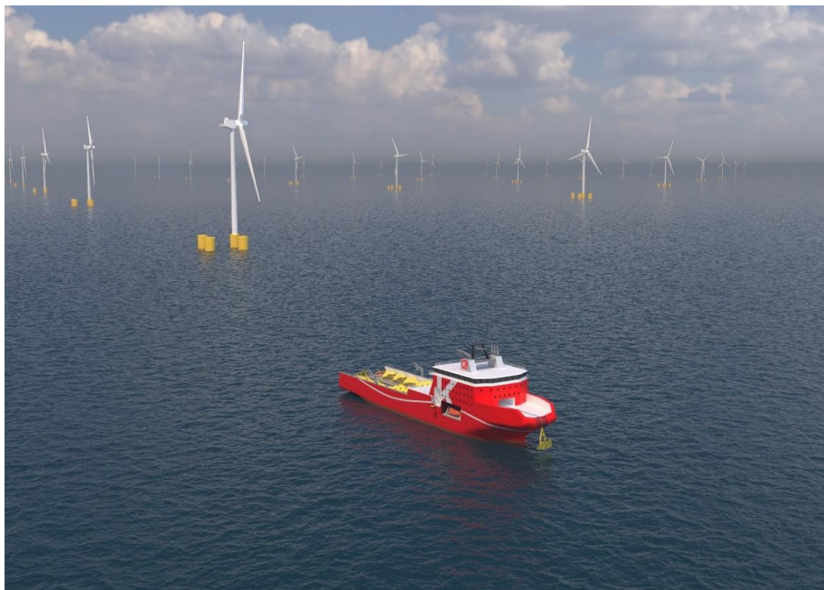
浮体式洋上風車向け専用船イメージ図

なお、本件はグリーンイノベーション基金事業「低コスト施工技術（風車浮体設置）の開発」の一環として、国立研究開発法人新エネルギー・産業技術総合開発機構（NEDO）の助成を受けて研究開発を進めたものです。（注2）